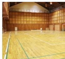
■室内多目的ホール