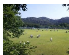
■天然芝のグラウンド