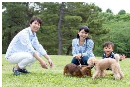
■ペットと泊まれる