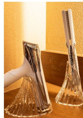
202 号室「薄紅」(うすべに)《和モダン シャワーユニット付き客室》18 畳

インテリアは伝統的な和の要素と現代的なスタイリッシュなテイストを融合した和モダンな空間。