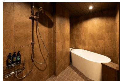
201 号室「花緑青」(はなろくしょう)《和モダン バス付客室》18.5 畳